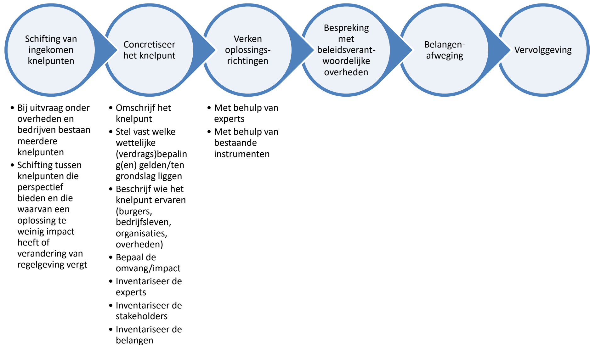
Bijlage 1: Stappenplan methodiek 'niet aanpassen, maar afwijken'