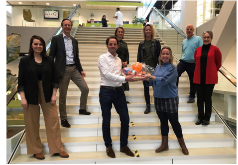
ORANGEHealth bij Health Holland

In deze eerste nieuwsbrief blikken we terug op het eerste jaar van ORANGEHealth, de publiek private samenwerking van de 7 tandheelkundige opleidingsinstituten en ruim 80 partners in het beroepsveld. In februari bezochten wij Health Holland met felicitaties voor de toekenning van de PPS toeslag voor het kick-start project Orange FORCE – oral and general health for older people's care. Vanaf april ging dit project van start, met de officiële kick-off tijdens de Dutch Dental Science Days. Hierbij waren meerdere praktijkpartners aanwezig en was een bijdrage vanuit de ouderenorganisatie. In oktober werd de kick-off voor bestuurders georganiseerd. Om de samenwerking van de industriële partners te bezegelen hebben de private partners en de onderzoeksinstituten in december een overeenkomst getekend. Hierin is o.a. vastgelegd hoe zij gaan samenwerken, hoe de resultaten gebruikt worden en hoe nieuwe partners kunnen aansluiten. Wij kijken erg uit naar de ontwikkelingen die gaan volgen in 2023!